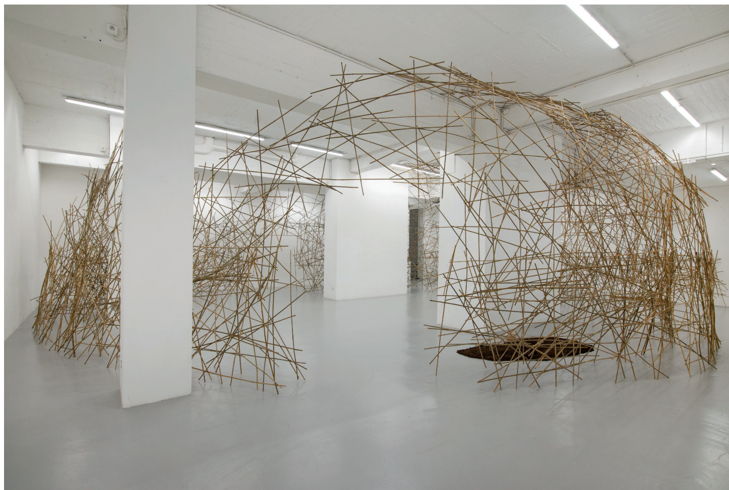
Scénographie artistique La ruche , Nicolas Pinier, 2021